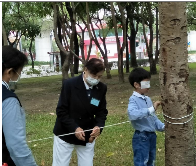
05 老師在旁協助安全，但不出聲音