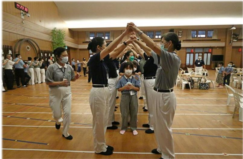
1.兩人一組搭手作山洞