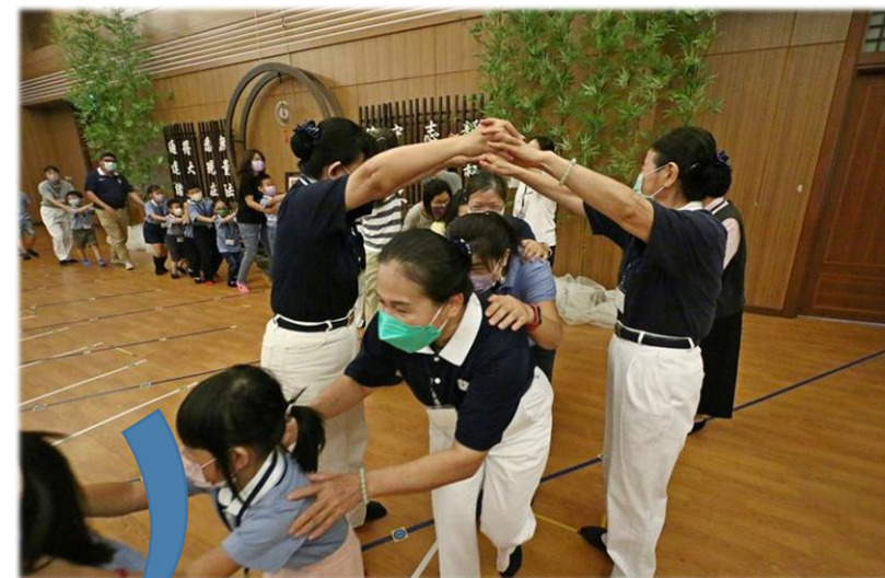
3.音樂一停，山洞落下，被圈住者，倆倆搭手成為山洞