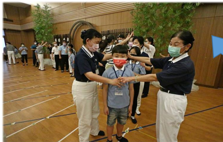
山洞愈來愈多.終成為雙重圓